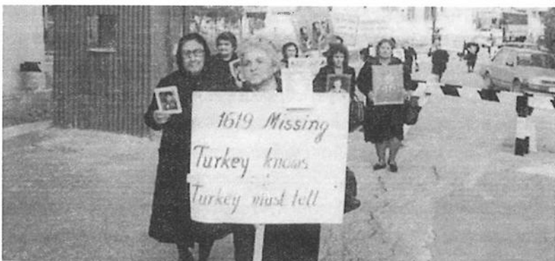
ΣΤΙΣ ΠΡΩΤΕΣ ΕΚΔΗΛΩΣΕΙΣ ΓΙΝΟΤΑΝ ΛΟΓΟΣ ΓΙΑ 2500 ΑΓΝΟΟΥΜΕΝΟΥΣ. ΓΥΡΩ ΣΤΟ 1976 Ο ΑΡΙΘΜΟΣ ΤΩΝ ΑΓΝΟΟΥΜΕΝΩΝ ΜΕΙΩΘΗΚΕ ΣΤΟΥΣ 2000. ΤΟ 1981 ΕΜΦΑΝΙΣΤΗΚΕ ΓΙΑ ΠΡΩΤΗ ΦΟΡΑ Ο ΑΡΙΘΜΟΣ 1619.